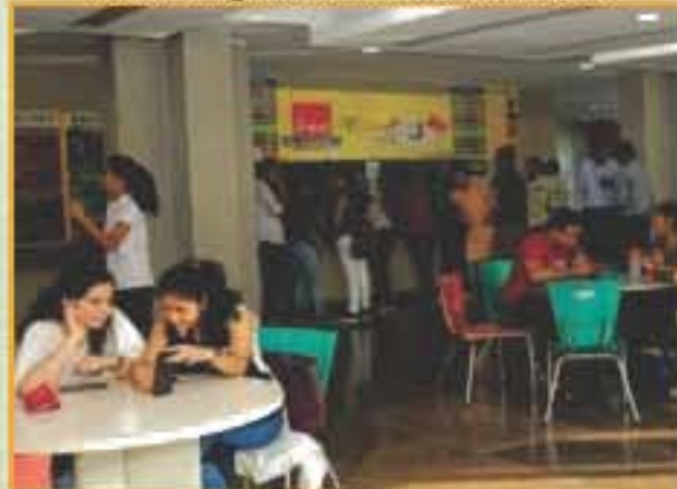
कैंफेटेरिया का दृश्य / Cafeteria View