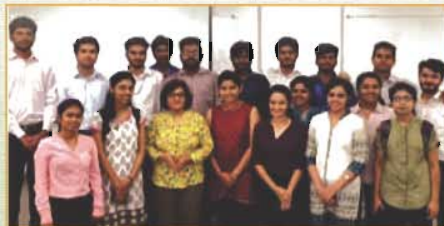
सीआरडी टीम/CRD Team