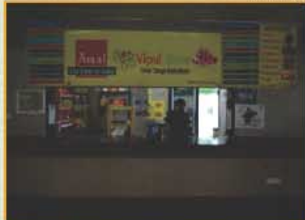
कैंफेटेरिया में विपुल स्टोर्स / Vipul Stores at Cafeteria