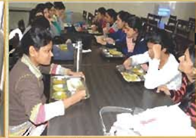
लड़कियों के छात्रावास का भोजन हॉल Girls Hostel Dining Hall