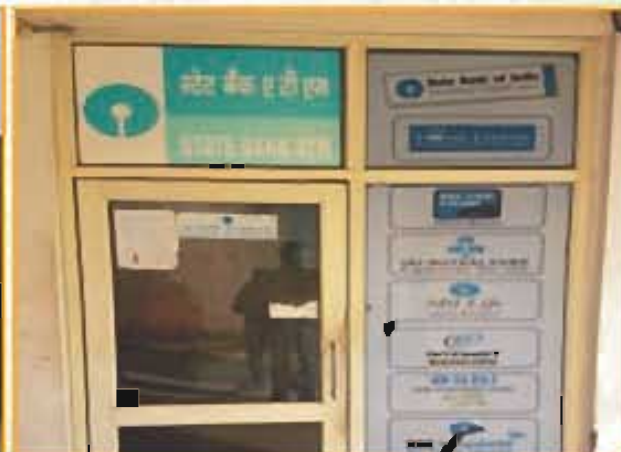
एचवीआई पर्यटन, निफ्टेम / SBIA/ATM, NIFTEM