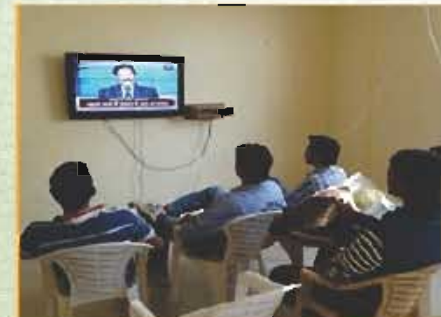
कॉमन रूम का दृश्य View of Common Room