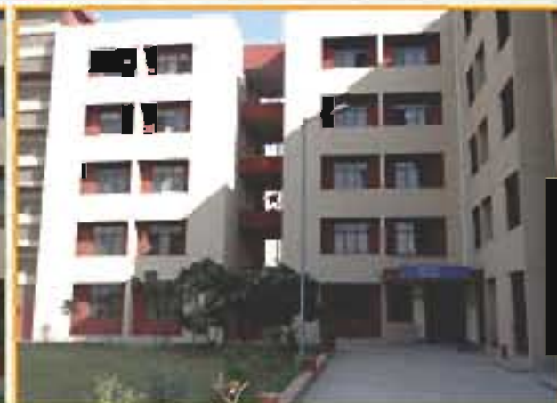
कावेरी छात्रावास (लड़कियों) Kaveri Hostel (Girls)