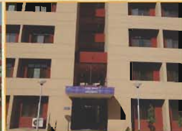
सतलज छात्रावास (लड़कों) Sutlej Hostel (Boys)