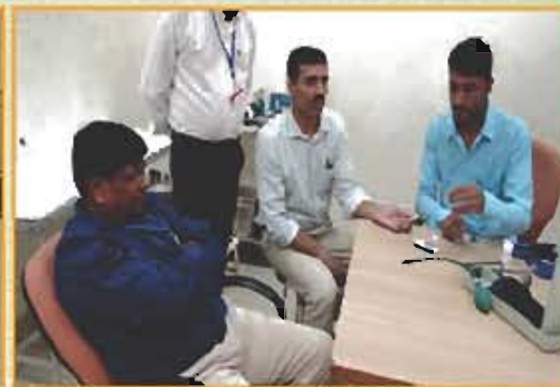
डिस्पेंसरी / Dispensary