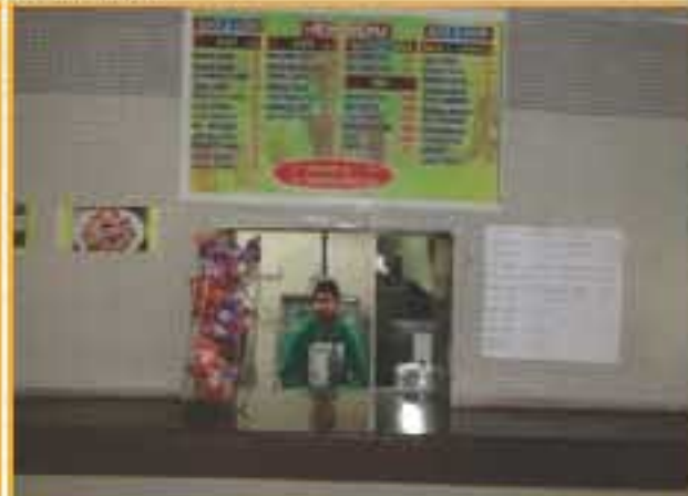
कैंफेटेरिया में जूस एन मोर शॉप / Juice-N-More Shop at Cafeteria