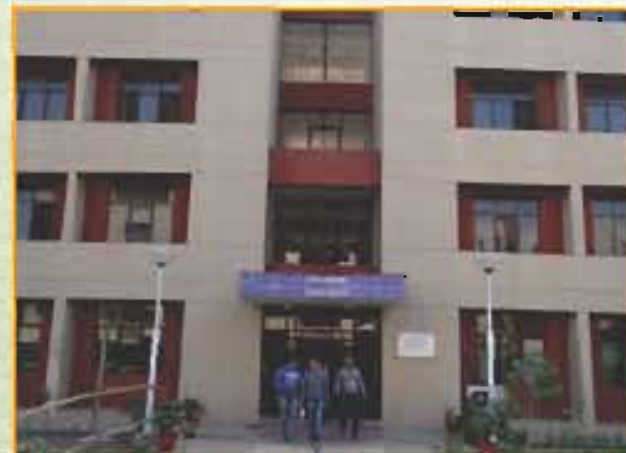
गंगा छात्रावास (लड़कों) Ganga Hostel (Boys)