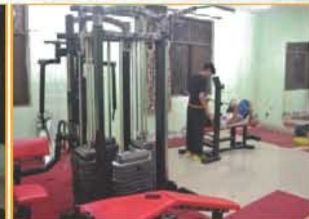
छात्रावास में जिम / Gym in Hostels