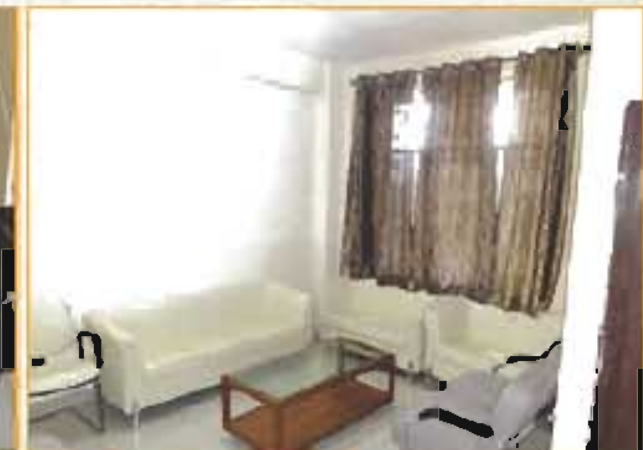
छात्रावास/उपनिवेश के लिए अभ्यर्थकों के लिए अभ्यर्थकों के लिए Hostel / Visitor Lounge for Parents / Guardians