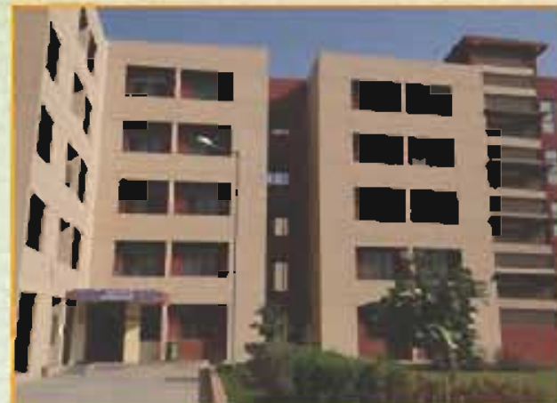
ब्रह्मपुत्र छात्रावास (लड़कों) Brahmaputra Hostel (Boys)

There are separate hostels for boys & girls. Four Hostels namely Brahmaputra, Sutlej, Ganga (Boy's Hostels) & Kaveri (Girl's Hostel). Ambience with the right blend of studies and extracurricular activities has been created in the hostels. The living rooms are well furnished and spacious with all the modern amenities. Each Hostel has a separate gymnasium equipped with the latest state of art equipment to ensure the good physical health of the students. Staying in the hostel is mandatory for each student.