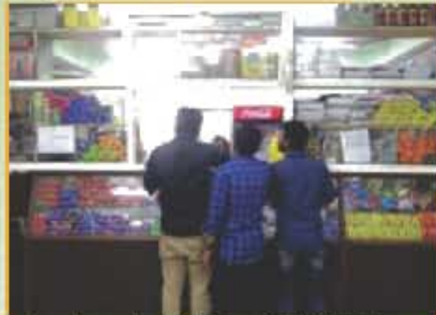
ब्रह्मपुरा छात्रावास टर्कशॉप / Brahmaputra Hostel Tuck shop

A 24 Hour Canteen service has been provided in the hostels for the students. This provides hygienically prepared snacks, soft drinks and other eatables to students on payment basis.