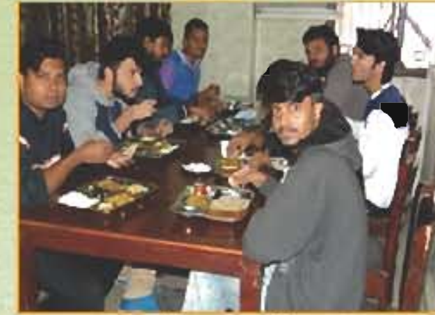
लड़कों के छात्रावास का भोजन हॉल Boys Hostel Dining Hall