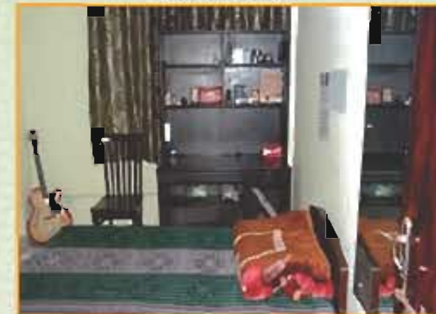
लड़कों का एकल सेक्टर छात्रावास Boys Hostel Single Sector