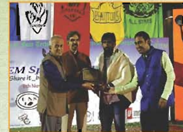
निफ्टेम स्पोर्ट्स लीग 2017 की झलकियां / Glimpses of NIFTEM Sports League 2017

Grounds for outdoor & indoor sports activities like Volley Ball, Wrestling, Football, Basket Ball, Badminton, Lawn Tennis, Table Tennis and Billiards with full flood-light arrangements have been constructed as per standards in the campus.