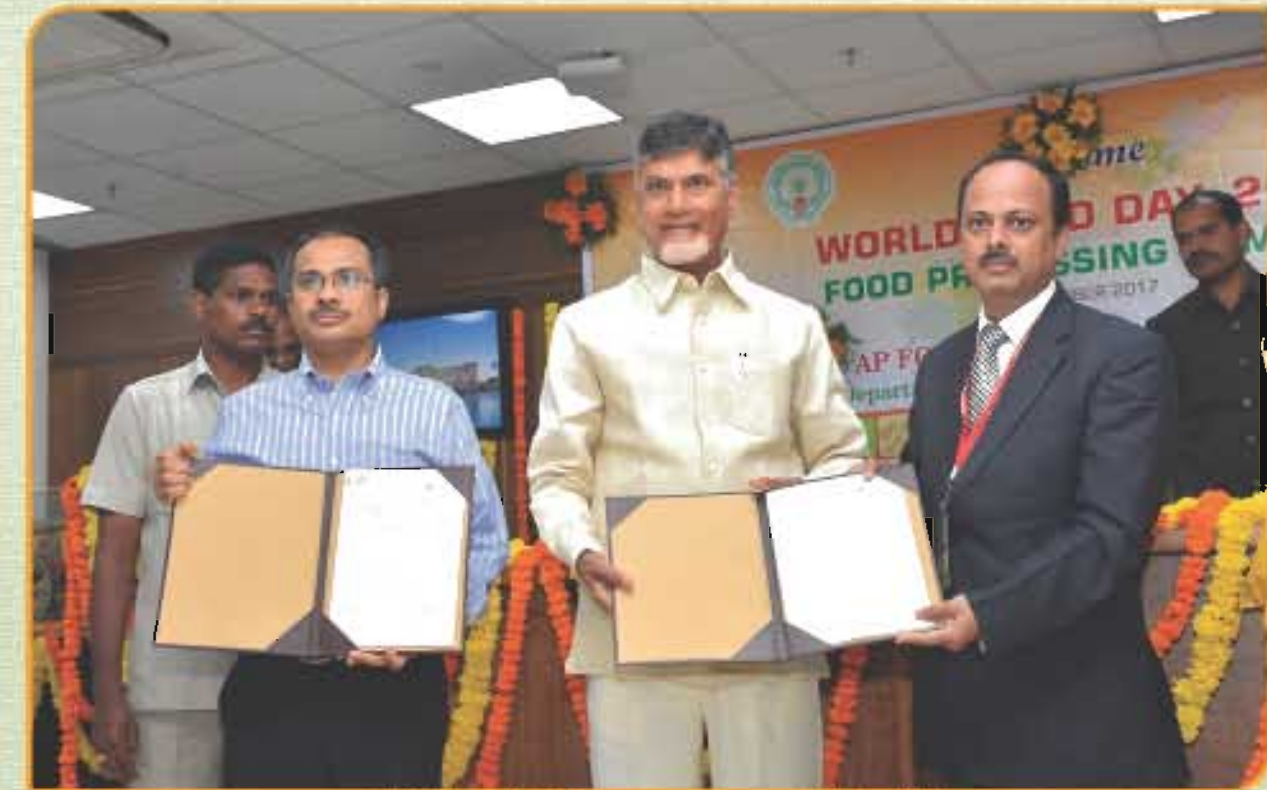
Dr. P. K. Nema, HoD, FE, NIFTEM (extreme right) signing MoU in the presence of Shri Chandrababu Naidu, Hon'ble Chief Minister, Government of Andhra Pradesh