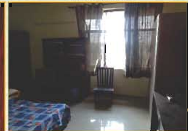
लड़कों का दो सेक्टर छात्रावास Boys Two Sector