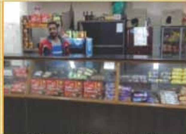
कनौरी छात्रावास टर्कशॉप / Kanwar Hostel Tuck shop