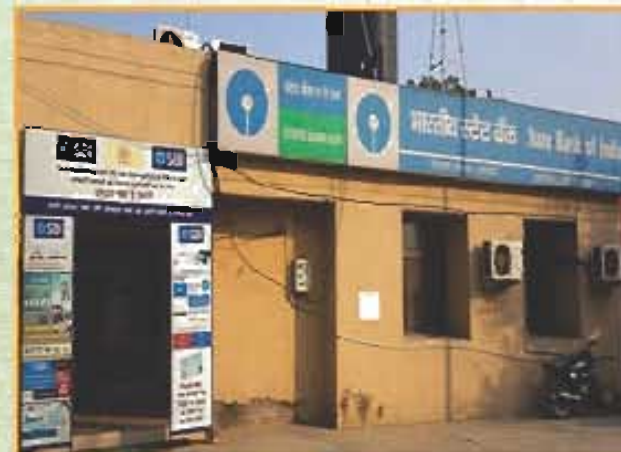
एचवीआई, निफ्टेम / STATE BANK OF INDIA, NIFTEM BRANCH

NIFTEM Campus have a branch of State Bank of India in its Campus near the Hostel which facilitates the students in every financial requirement. State Bank of India also offers the "COLLATERAL FREE EDUCATION LOAN" for NIFTEM Students which helps the financially weaker students the opportunity to get good higher education.